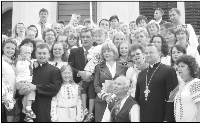
Зустріч групи прочан з Івано-Франківська з Президентом України Віктором Ющенком. Фатіма (Португалія) 24.06.2008

нас трьохсотлітнім храмом Sagrada Familia (Пресвятої Родини). Цей іспанський храм будується уже триста років виключно на кошти прочан. Красиве місто Середземномор'я